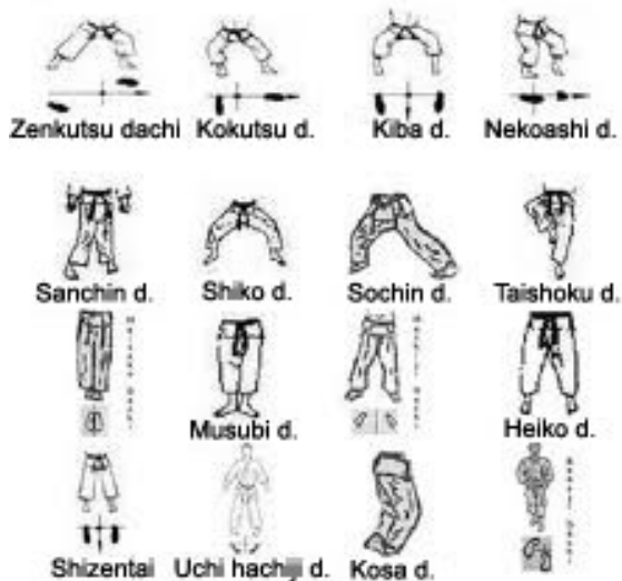
Sl.br.2 Stavovi u karateu

- Stavovi predstavljaju položaje tijela, a razlikuju se po položaju nogu, ruku, trupa, i taktičkoj namjeni. Uloga im je da omoguće izvođenje tehničkih elemenata u najpovoljnijim uslovima. Stav treba da omogući karate borcu stabilnost, efikasan prlazak u drugi stav, kretanje, bez obzira da li se radi o napadu ili odbrani. Prema tome, stav treba da ispunjava sljedeće elemente: stabilnost, stajanje pretežno na prednjim dijelovima stopala, elastičnost u koljenima, uspravan trup, opuštene ramena sa šakom prednje ruke podignutom u visini ramena, a stražnje u visini pleksusa.