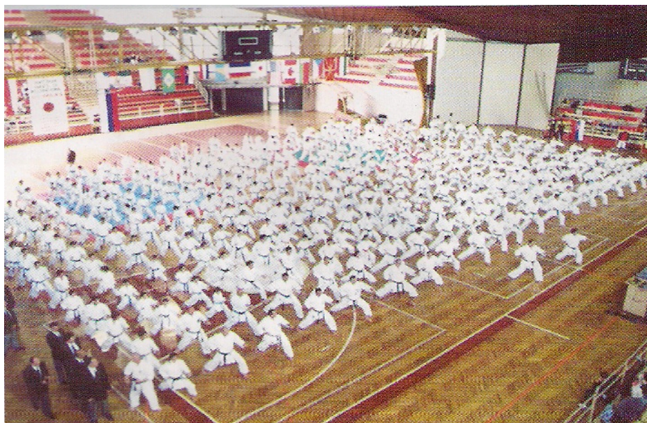
Sl.br.1 Sportski karate trening

Karate sport pripada grupi polistrukturalnih acikličnih sportova u čijoj osnovi se nalazi sukob sa protivnikom s ciljem poentiranja uz simboličnu destrukcija protivnika. Sadrži veliki broj tehnika u koje spadaju stavovi, udarci, blokovi, kretanja, čišćenja i bacanja, kao i veliki broj kata-formalnih vježbi.