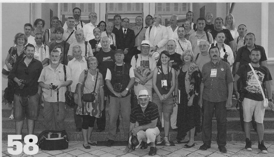
DANI FOTOGRAFIJE SRBIJE