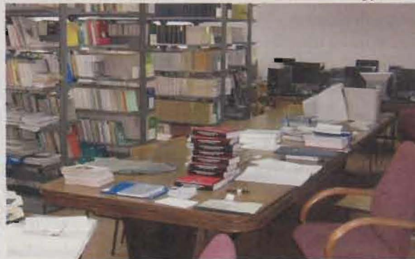
Potrebna je nabavka nove opreme kao i upotpunjavanje bibliotečkog fonda