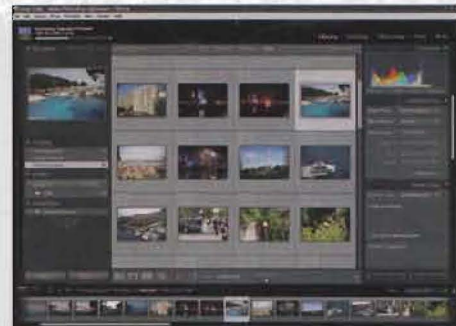
■ Obrada fotografija - Nakon ljetnog skitanja i masovnog okidanja digitalnim fotoaparatom, čeka vas sređivanja kolekcije. Predstavljamo niz alata za taj „pduhvat“