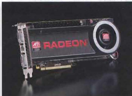
■ Radeon HD 4870 X2 - Kruna grafičkih performansi ponovo pripada AMD-u što treba zahvaliti crnim zvjerkama - Radeonima HD 4870 X2, koje testiramo u ovom broju