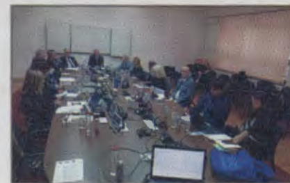
Održan sastanak UO UniAdrion mreže