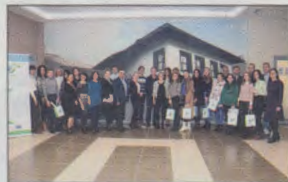
Održana završna konferencija Erasmus+ projekta „ECOBIAS”