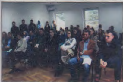
Promocija UNIGEM istraživanja na UNMO