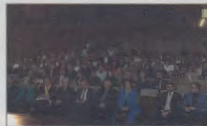
Održana Konferencija „Conference of Radiologic Technologies“ - CORT