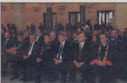
Obilježene 73 godine rada i razvoja UNSA