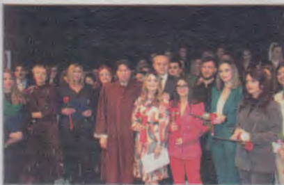
Медицински факултет у Фочи промовисао младе љекаре