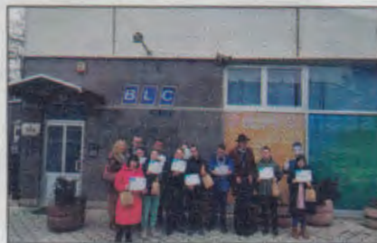
Deset osoba sa Daunovim sindromom završilo školu novinarstva