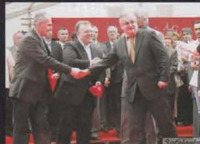
Svečano otvorenje jedine rafinerije šećera u BiH

Predsjedavajući Vijeća ministara BiH Nikola Špirić i direktor Agencije za unapređenje stranih investicija u BiH (FIPA) Haris Bašić uručili su ček u vrijednosti 260.000 KM za Studen-Agrani d.o.o.