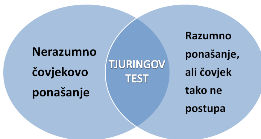
Slika 1. Koncept Tjuringovog testa

Sam Tjuring je zastupao tezu da će još 2000. godine postojati računari koji će imati sposobnost da igraju ovu vrstu „igre“, tako da prosječan ispitivač nema više od 70% šanse da uradi ispravnu identifikaciju, nakon pet minuta postavljanja pitanja. Da je on bio u pravu, danas bi bili u mogućnosti da ispred sebe imamo mašinu koja je uistinu inteligentna, odnosno koja može da se predstavi kao inteligentna. Problem zbog koga to nije tako je zbog sposobnosti ili tačnije nesposobnosti računara za pravilnu obradu podataka, a ne u pogledu toga da stručnjaci