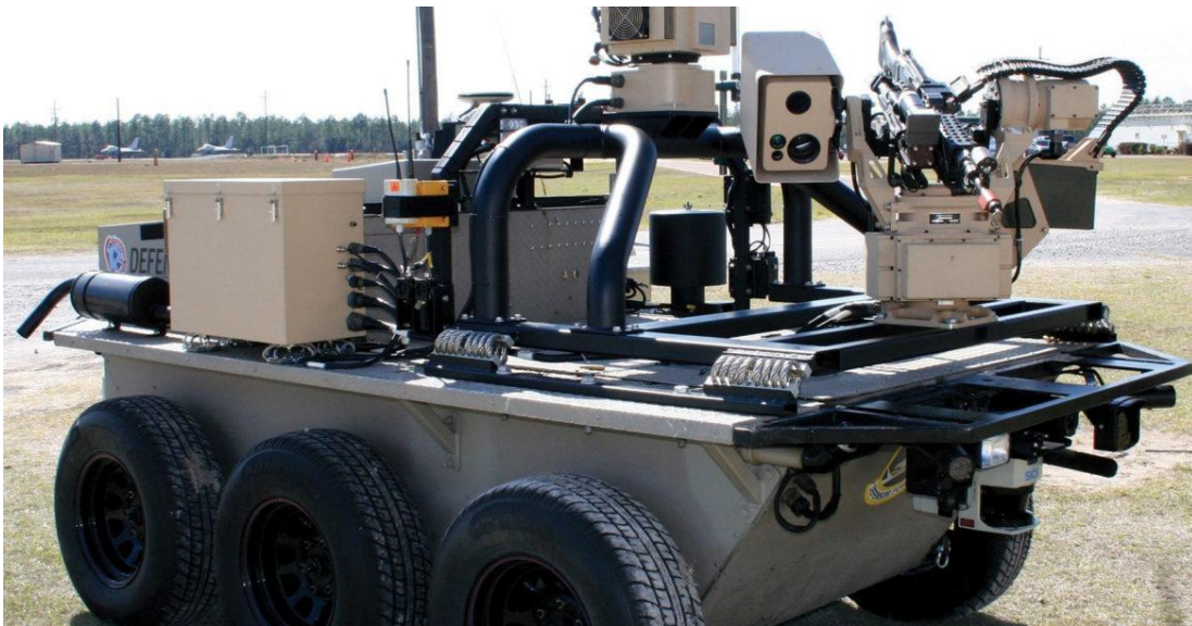
Slika 4. Primjer smrtonosnog autonomnog sistema oružja „Robot killer“ 26

Direktiva Ministarstva odbrane SAD 3009 zahtjeva da svi sistemi bazirani na AI, bez obzira na klasifikaciju, budu dizajnirani tako da omoguće komandantima i operaterima da