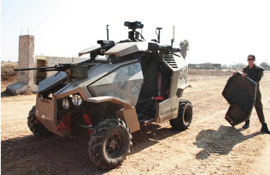
Slika 3. Primjer autonomnog vozila razvijenog od strane DARPA 23

„Rojstvo“ („Swarming“) je jedinstveni podskup autonomnog razvoja vozila, sa konceptima koji se kreću od velikih formacija jeftinih vozila dizajniranih da prevladaju odbrambene sisteme do malih eskadrila, vozila koja saraduju kako bi obezbedili elektronski napad, podršku za vatru i lokalizovane mreže za navigaciju i komunikaciju formacije trupa (kao roj insekata, po čemu je sistem i dobio ime). Trenutno se razvija nekoliko različitih rojevačkih sposobnosti. Na primjer, u novembru 2016. godine, mornarica je završila testiranje roja od pet bespilotnih brodova koji su zajednički patrolirali dijelom od 4 do 4 milje zaliva Chesapeake i presreli brod „uljez“. Rezultati ovog eksperimenta mogu dovesti do razvoja AI tehnologije prilagođene za odbranu luka, lovnih podmornica ili izviđanje pred većim brodovima. Mornarica