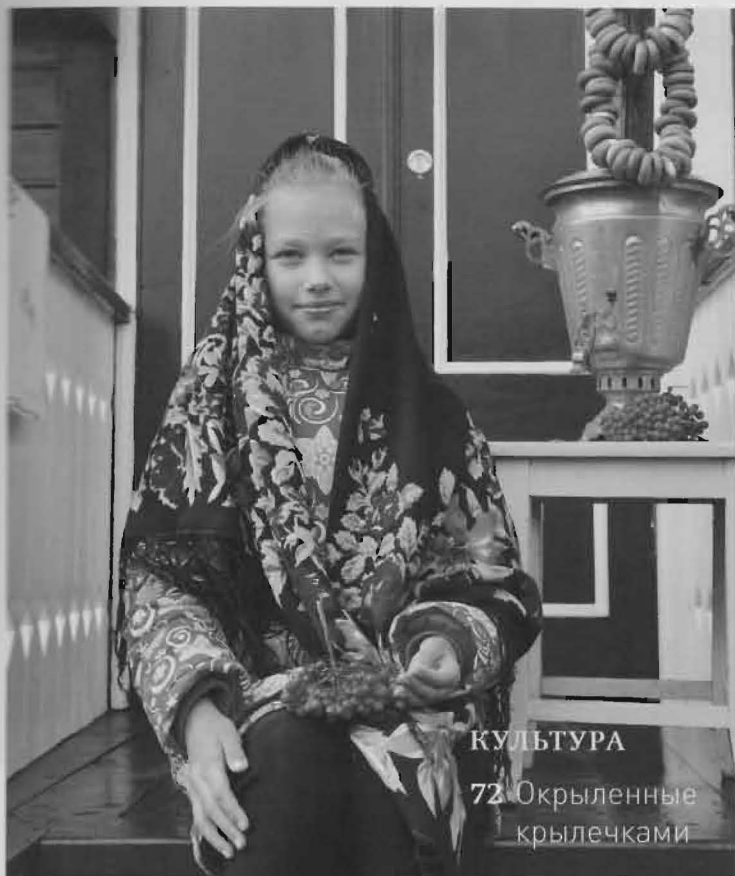
КУЛЬТУРА 72 Окрыленные крылечками