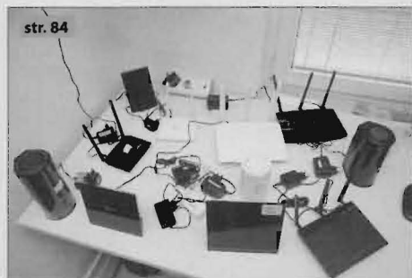
str. 84 Veliki test 802.11ac routera - U neobično raznolika kućišta proizvođači pakiraju routere nove generacije. Eto, i oni su počeli paziti na dizajn!

“ Cilj nam je bio napraviti temu koja će biti zanimljiva za čitanje čak i onima koji se uopće ne igraju, jer bavimo se fenomenima, a ne opisom samih igara. A za nas koji se igramo, ovo je odavanje počasti naslovima koji su značajno obilježili vrijeme u kojem živimo ”