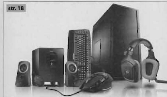
str. 18 Osvojite Linksov PC vrijedan 33.333 kuna - Najvrjednija nagrada svih vremena - u Bugovim nagradnim igrama! Traži se najsretniji čitatelja svih vremena!