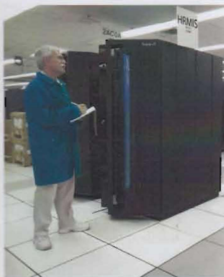
Slika 1.1.4 Logo Nacionalne škole za upravu iz Velike Britanije i IBM Rack u kojem se nalazi HRMIS hardware

Implementacija informacionog sistema HRMIS u Republici Srpskoj počela je 10 juna 2009. godine instalacijom aplikativnog softvera. Planirana obuka za 120 državnih službenika odvijala se u periodu od 31 avgusta do 6 oktobra. Obuka se odvijala u sali za obuke ADU RS, koja u tu svrhu opremila učionicu sa 12 računara. Obuka je organizovana u 10 grupa .