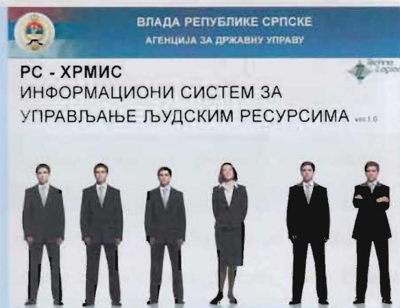
Slika 1.1.1 Izgled početnog ekrana aplikacije

Strategija reforme javne uprave BiH ( Public Administration Reform - PAR), koju je 2006. godine usvojio Savjest Ministara, vlade oba entiteta i Brčko Distrikta, obuhvata Upravljanje ljudskim potencijalima kao jednu od šest glavnih područja reforme. Štaviše, prema dijelu Strategije koja se odnosi na upravljanje informacijama snažno se podstiče upotreba informacionih i komunikacionih tehnologija kako bi se uspostavili sveobuhvatni informacioni sistemi koji će omogućiti efikasniji i transparentniji rad javne uprave. U skladu sa Akcionim planom 1, kao pratećim dokumentom stretegije, koji je usvojen zajedno sa Strategijom reforme javne uprave, Evropska komisija, krajem 2006 godine, inicira razvoj informacionog sistema za upravljanje ljudskim resursima. Projekat HRMIS (Human Resources Management Information System) ima za cilj razvoj informacionog sistema (softvera ) za upravljanje ljudskim resursima koji bi koristili svi nivoi vlasti u BiH.