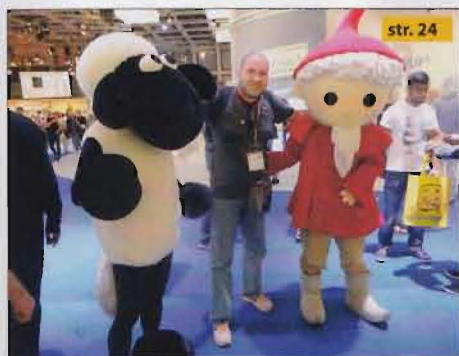
❖ IFA 2013, Berlin – Naš je izvjestitelj već sedmu godinu zaredom prošetao najveći tehnološki sajam u Europi, ovaj put u društvu sebi sličnih novinara

” Ono po čemu je ovaj Bug poseban i po čemu će se, nadamo se, pamtit sigurno je tema broja – prvi put posvećena 3D piscima ”