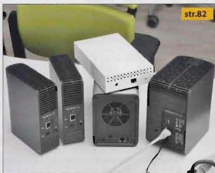
❖ Kućni NAS-ovi – Danas su vrlo jednostavni za konfiguraciju te nude odličnu podršku za mobilne uređaje. Isprobali smo pet modela s tvornički ugrađenim diskovima velikog kapaciteta