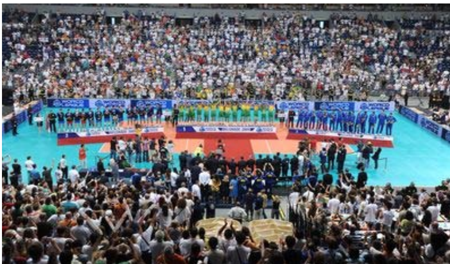
Slika 1. Finale Svetske lige 2009. godine, Beograd

psihološka spremnost pojedinca, azatimicelogtima, uslovzadobrutaktiku, jerjeusuprotrnominajmanjipogrešanpokretrukemoženarušiti.